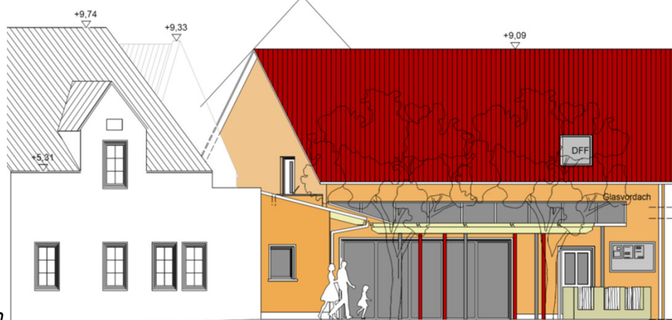
Ansicht von Osten