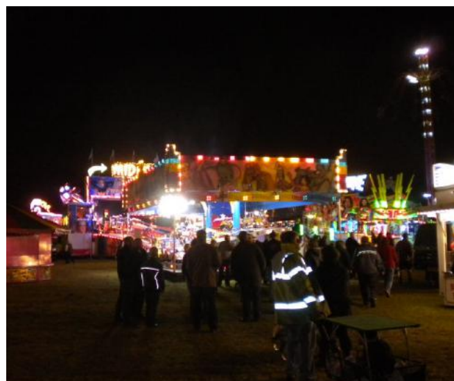
Angekommen am Abend, der Jahrmarkt lief schon auf Hochtouren. Hungrig! also hinein ins Gewühle.