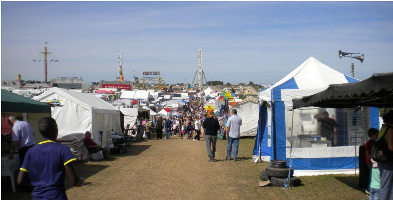
Der riesige Flohmarkt