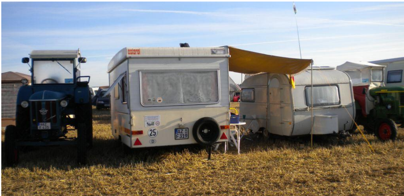
Unser Platz während des 5-tägigen Festivals