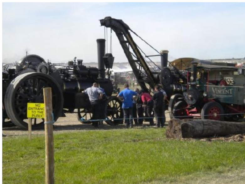
Reparatur einer Dampfmaschine mittels Dampfkran & Dampf-Lkw, stilecht!