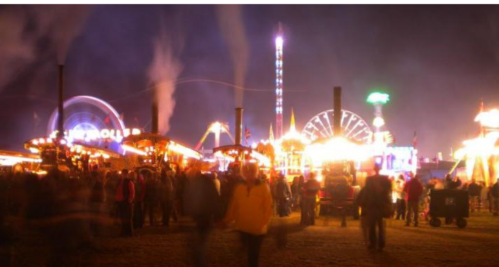
Historischer Jahrmarkt mit 70 Showmans Dampfmaschinen nachts, einmalig!