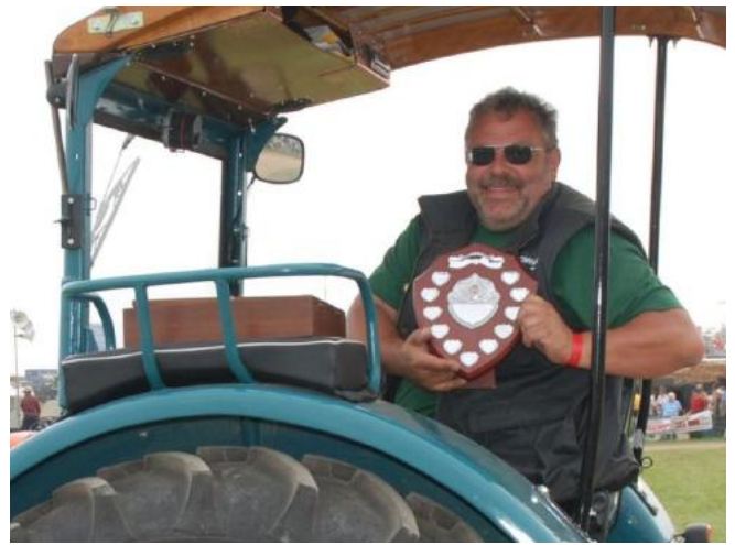
Traktorvorstellung im Main-Ring Preis als "best restored oversea tractor" gewonnen