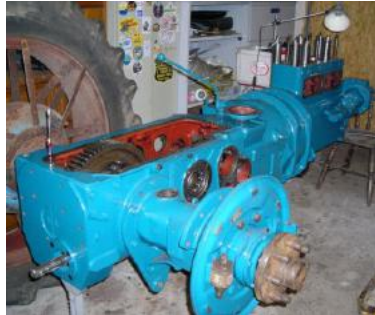
Hätte nie gedacht das der mal wieder läuft