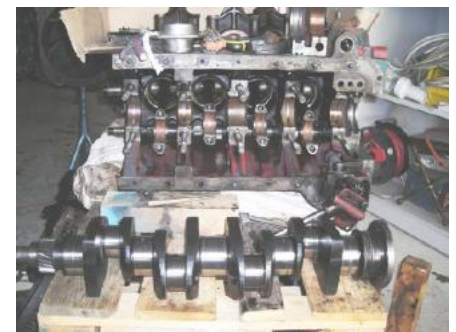
3 Jahre Restaurationsarbeit am Hanomag