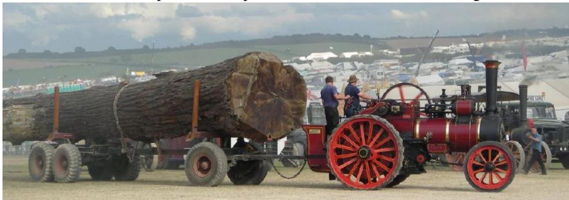
70 wunderschöne Showmans - Dampfmaschinen, gut gewartet im 24 Std Einsatz, tags & nachts ein Erlebnis