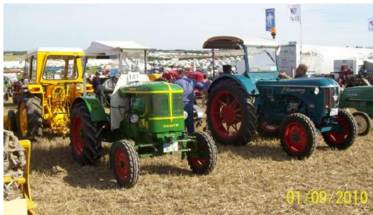
Unsere Traktoren werden ausgestellt