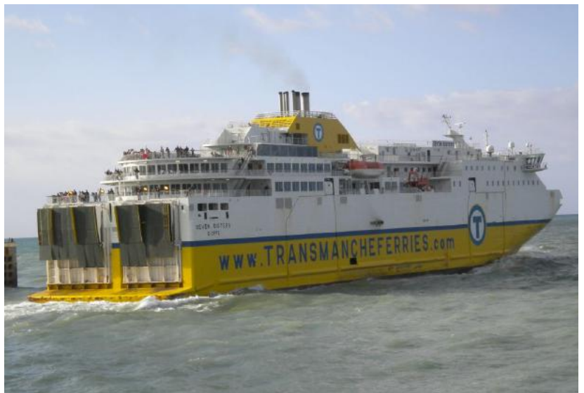
Unsere Fähre Dieppe - Newhaven