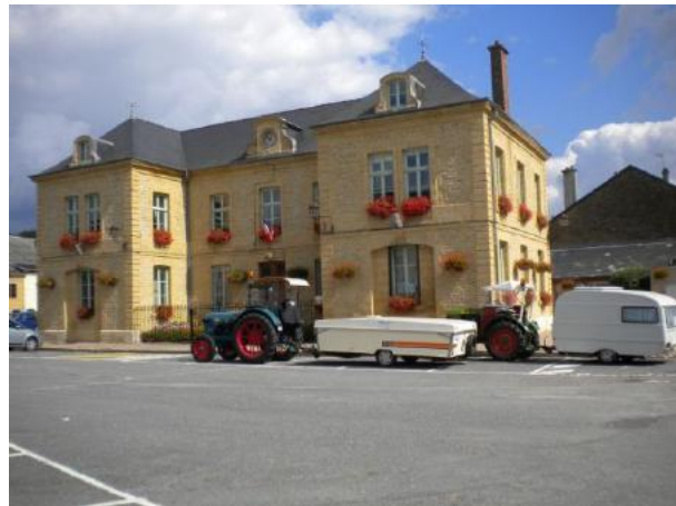
Rathaus in Floing (F)