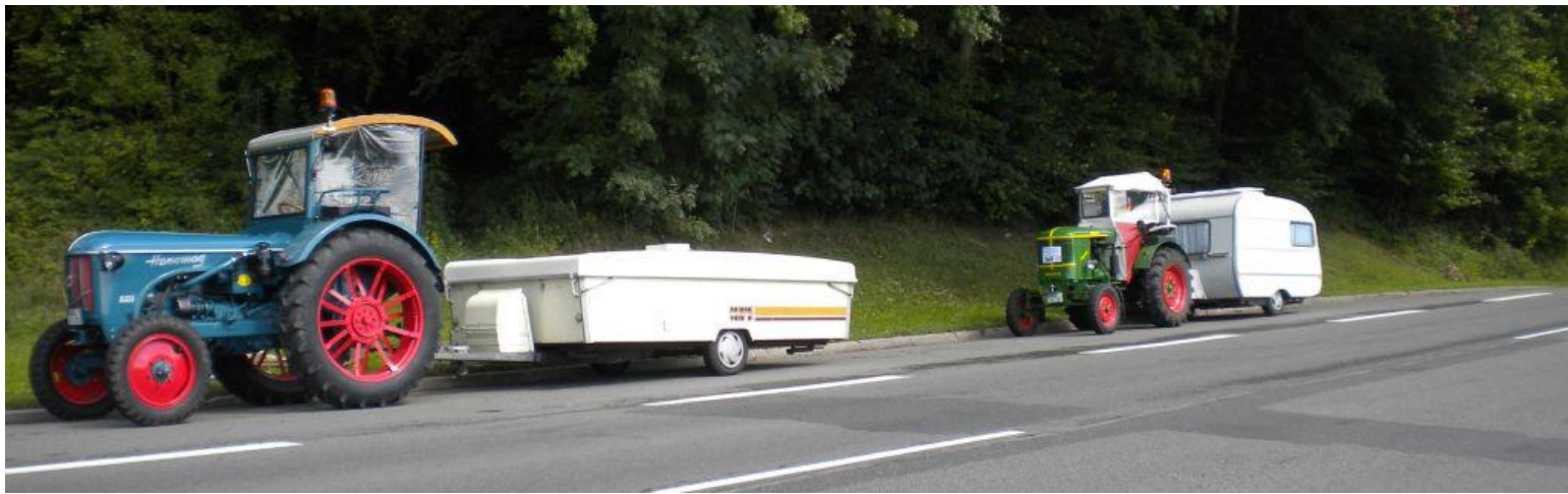
Unterwegs in Belgien, regendicht aber gut gekühlt.