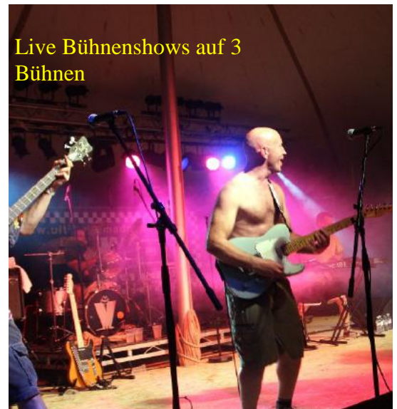
Live Bühnenshows auf 3 Bühnen