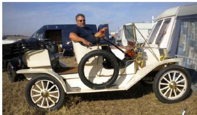
Die Atmosphäre ist ganz toll. Einfach ein Riesenspielplatz für Technik-Begeisterte. Wir haben interessante Teilnehmer aus Irland und Frankreich kennengelernt