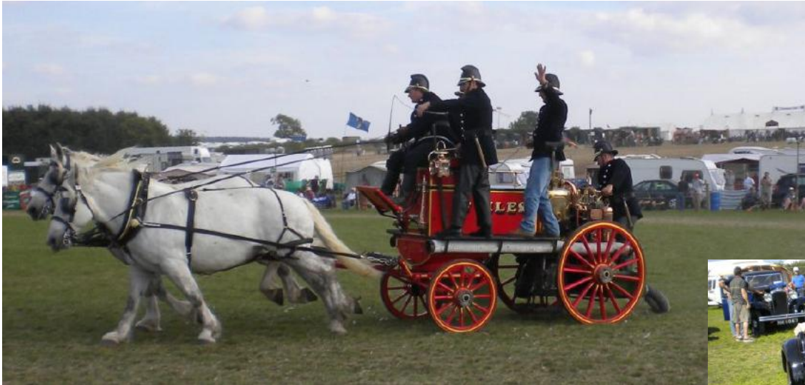
Dampffeuhrwehr im Einsatz mit Shire-Horses